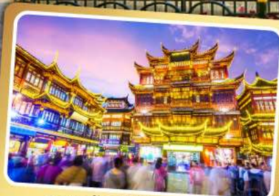
ตลาดร้อยปีเฉิงหวงเหมียว