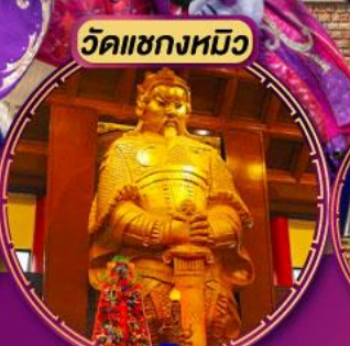
ขอพรโชคลาภ การเงิน และธุรกิจ