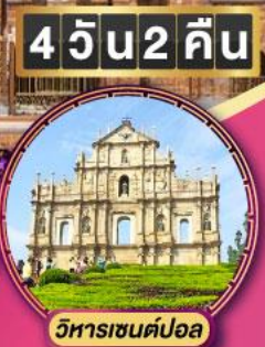
วิหารเซนต์ปอล