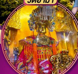
ขอพรด้านสุขภาพ และการเดินทางปลอดภัย