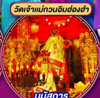
นมัสการ องค์เจ้าแม่กวนอิม ที่มีอายุกว่า 600 ปี