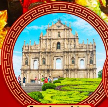
โบสถ์เซนต์ปอล