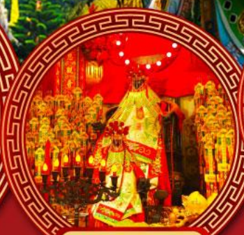
วัดเจ้าแม่กวนอิม ฮองฮ่า