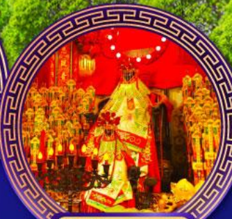
วัดเจ้าแม่กวนอิม ฮองฮ่า