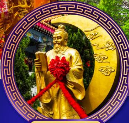
วัดหวังต้าเซียน