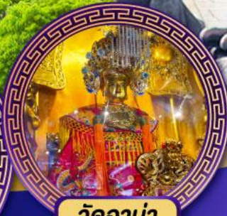
วัดอาม่า