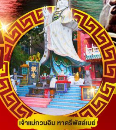
เจ้าแม่กวนอิม หาดศรีพัลลภ