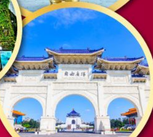
อนุสรณ์เจียงไคเช็ค