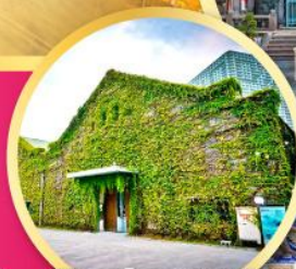
Huashan 1914 Creative Park