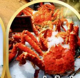
ตลาดปลาไทเป