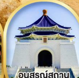
อนุสรณ์สถาน เจียงไคเช็ค