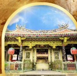
วัดหลงชาน