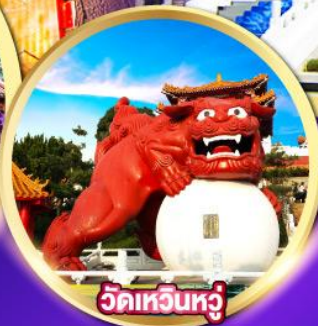
วัดเทวอินทวู่