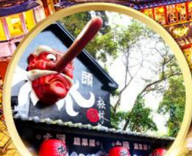
หมู่บ้านปีศาจซีโกว