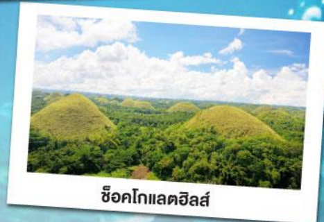
ช็อคโกแลตฮิลล์