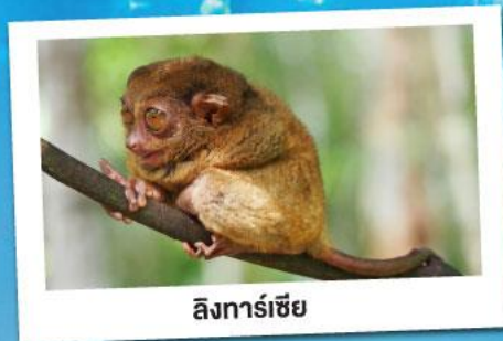
ลึงทาร์เซีย