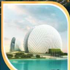
โรงละครหอยโข่มุก