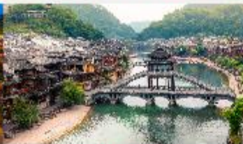
เฟิ่งหวง