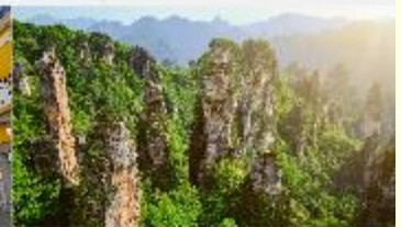
หุบเขาวงตาร

*ทางบริษัทฯ ขอสงวนสิทธิ์ในการปรับเปลี่ยนโปรแกรมทัวร์ตามความเหมาะสมขึ้นอยู่กับสถานการณ์ปัจจุบัน โดยค่าใช้จ่ายดังตั้งผลประโยชน์ของลูกค้าเป็นสำคัญ