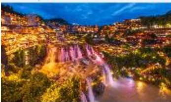
ฝูหรงเจิน