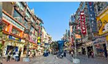
ถนนหวงซิงลู่