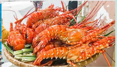
Nha Trang Night Market

*ทางบริษัทฯ ขอสงวนสิทธิ์ในการสลับโปรแกรมทัวร์ตามความเหมาะสมขึ้นอยู่กับสถานการณ์หน้างาน โดยคำนึงถึงผลประโยชน์ของลูกค้าเป็นสำคัญ