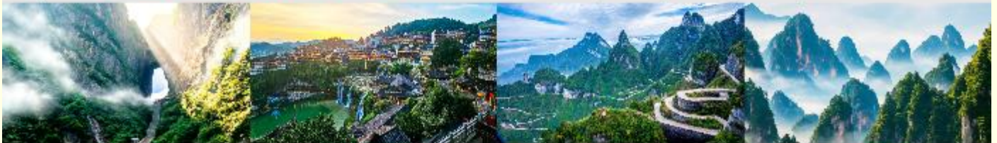
ประตูลั่วสวรงค์