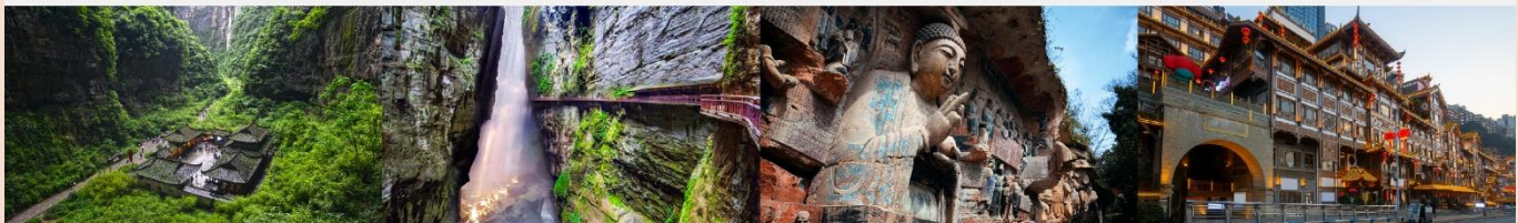
อุทยานแห่งชาติหลุมฟ้า 3 สะพานสวรรค์