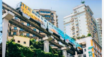
รถไฟฟ้าทะเลสาบ

*ทางบริษัทฯ ขอสงวนสิทธิ์ในการสลับโปรแกรมทัวร์ตามความเหมาะสมขึ้นอยู่กับสถานการณ์หน้างาน โดยคำนึงถึงผลประโยชน์ของลูกค้าเป็นสำคัญ