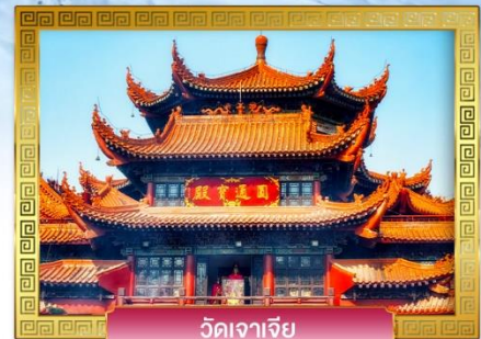
วัดจาเจีย