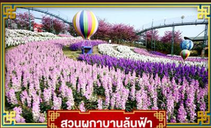
สวนดอกบานล้นฟ้า

อุทยานสวรรค์กุหาหิมะการ์เซียต้ากู่ปิงชว่น