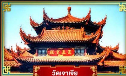
วัดจาเจีย