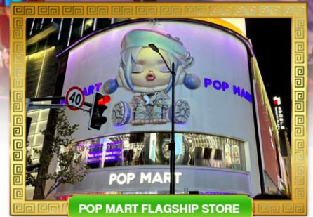
POP MART FLAGSHIP STORE