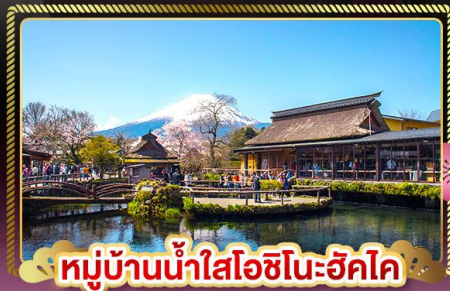
หมู่บ้านน้ำใสโอชิโนะฮัคโค