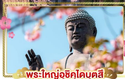
พระใหญ่อุซึคุโอบุตสึ