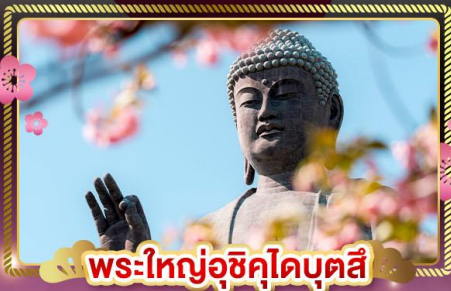
พระใหญ่อุซึคุโดบุตสึ