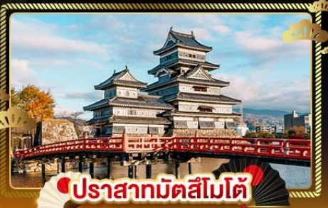
ปราสาทมัตสึโมโต้