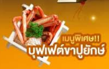
เมนูพิเศษ!! บุฟเฟ่ต์งาปูยักษ์