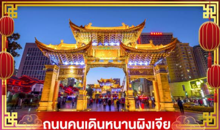
ถนนคนเดินหนานผิงเจีย