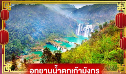
อุทยานน้ำตกเก้ามังกร