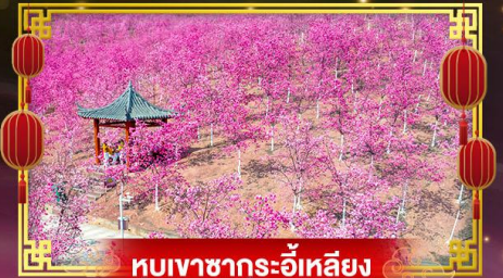
หุบเขาซากุระอิเหลียง