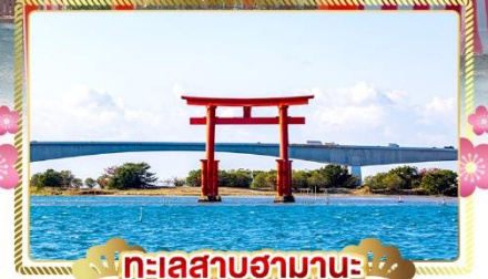
ทะเลสาบฮามานะ