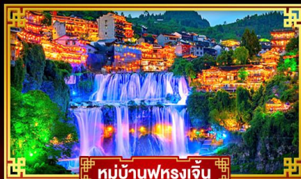
หมู่บ้านฟุรงเจิน