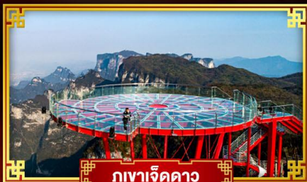
กูเงาเจ็ดดาว