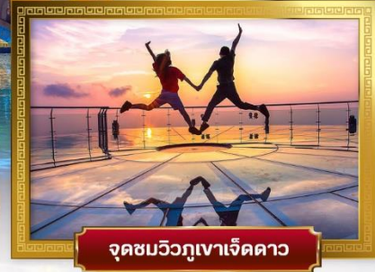
จุดชมวิวกูเขาเจ็ดดาว