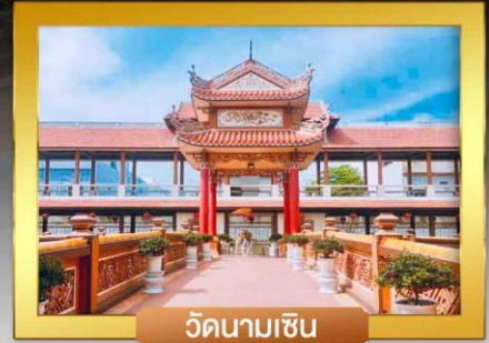
วัดนามเซิน